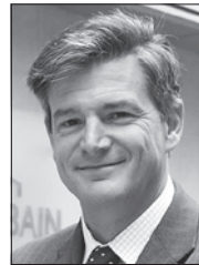
フランソワ・ザビエ・リエナール

ロンドン大学ユニバーシティカレッジ(UCL)教授 UCL持続可能な資源研究所所長 UCLスクール・オブ・エネルギー・アンド・リソース研究長