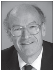
ポール・エキンズ

ロンドン大学ユニバーシティカレッジ(UCL)教授 UCL持続可能な資源研究所所長 UCLスクール・オブ・エネルギー・アンド・リソース研究長